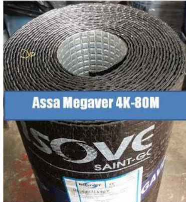
Assa Megaver 4K-80M

Sistema líder en calidad en el mercado de Puerto Rico cuando es combinado con la técnica Adheso de Assa. Distribuido por Assa Caribbean Inc. en Guaynabo, Puerto Rico. Para instalarse con garantías de hasta 20 años en mano de obra directamente del contratista. Garantía de fábrica disponible directamente de Assa.